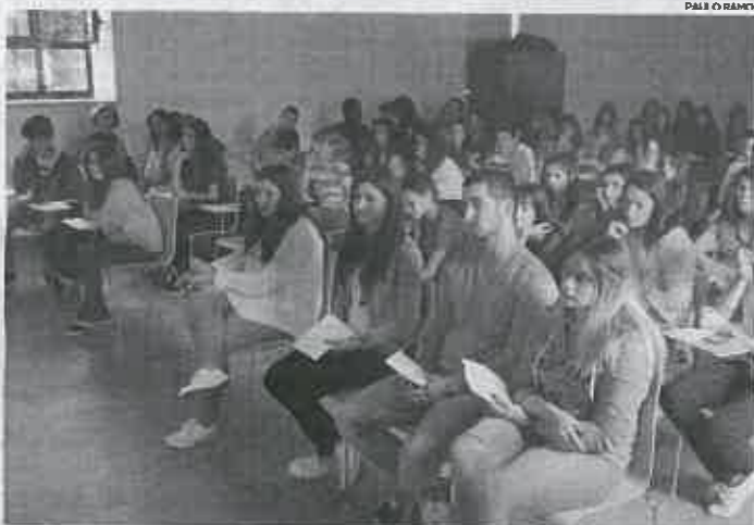
Ação de sensibilização envolveu estudantes de duas escolas de Aveiro