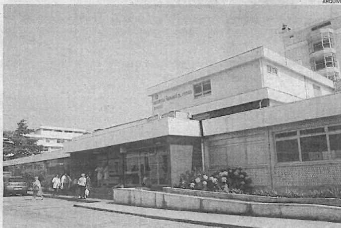
A administração do CHBV destaca a entrega dos profissionais neste processo

O processo de acreditação dos departamentos da Mulher e Criança e de Psiquiatria e Saúde Mental teve início em Janeiro de 2015 e, durante cerca de um ano e meio, os dois departamentos “corrigiram e adequaram os procedimentos e melhoraram as condições dos circuitos e da prestação de cuidados, de forma a responderem positivamente aos requisitos de