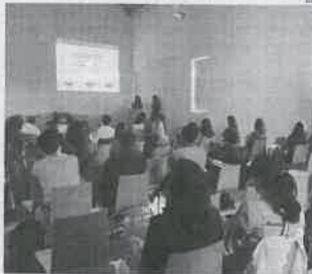
Internato Médico juntou profissionais em Aveiro

O Internato Médico realiza-se após a licenciatura/mestrado integrado em Medicina e corresponde a um processo de formação médica especializada, teórica e prática, que tem como objectivo habilitar o médico ao exercício tecnicamente diferenciado na respec-